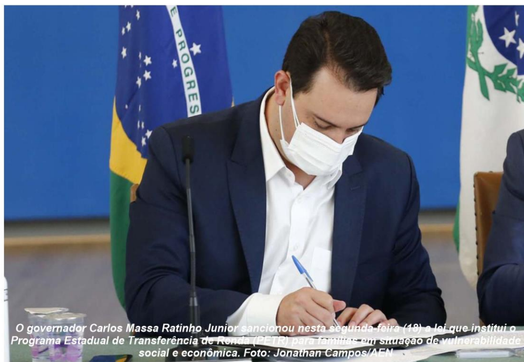
O governador Carlos Massa Ratinho Junior sancionou nesta segunda-feira (18) a lei que institui o Programa Estadual de Transferência de Renda (PETR) para famílias em situação de vulnerabilidade social e econômica.

O programa será coordenado pela Secretaria de Estado da Justiça, Família e Trabalho e contará com envolvimento de outras pastas e órgãos estaduais. Os recursos são oriundos do Fundo Estadual de Combate à Pobreza (Fecop), do Fundo da Infância e